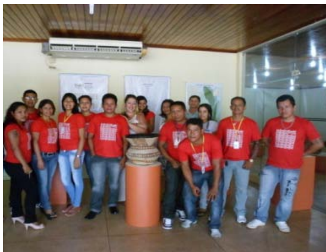
Equipe do Museu Kuahí

saberes e fazeres, vem também inaugurar o Programa de Formação de Pesquisadores Indígenas de Oiapoque, realizado pelo Kuahí com apoio da Secretaria de Cultura do Estado do Amapá – SECULT e do Iepé – Instituto de Pesquisa e Formação Indígena.