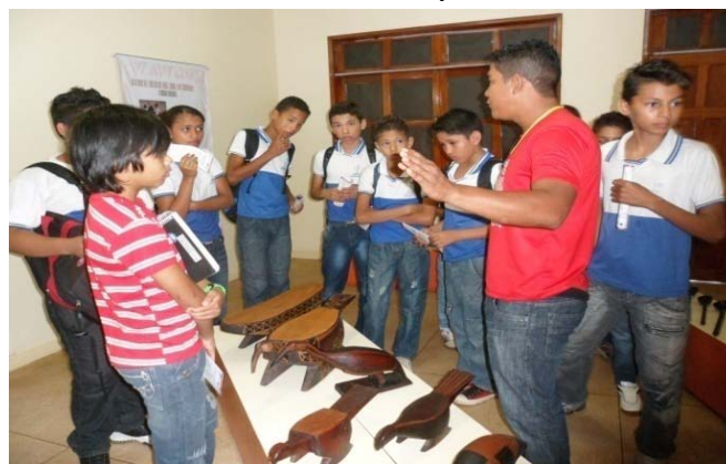
Alunos da Escola Joaquim Nabuco

Depois de duas semanas fechado ao público, para a preparação e montagem de uma nova exposição, o Museu Kuahí reabre suas portas na semana do índio, de 17 a 19 de abril, inaugurando a Exposição “A arte e o Saber dos Mestres”, que ficará exposta até abril de 2013. Esta exposição é resultado de um projeto de “Resgate cultural” desenvolvido em 2004 e 2005, nas aldeias dos rios Uaçá, Urucauá, Curipi e Oiapoque, nos próprios locais caseiros dos mestres-artesãos e de jovens aprendizes. Uma exposição preparada e montada pela a equipe do Museu, que traz ao público um pouco da história dos Povos Indígenas de Oiapoque em busca da continuidade da transmissão de seus