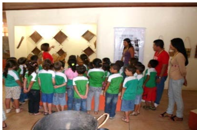
Alunos da Escola Joaquim Caetano

No decorrer da semana do índio, o Museu recebeu um número bastante elevado de visitação da população oiapoqueense, da Guiana Francesa, das comunidades indígenas e principalmente das escolas do município. Através dessa exposição, os visitantes podem observar todo conhecimento e arte que os quatro povos da região possuem. Também, possibilita que tenham uma visão mais correta e justa sobre os índios, que apesar de conviverem constantemente com diversas culturas, conseguem se relacionar e se desenvolver num processo civilizatório próprio, fortalecendo cada vez mais as suas culturas e mantendo sempre viva as suas tradições-culturais.